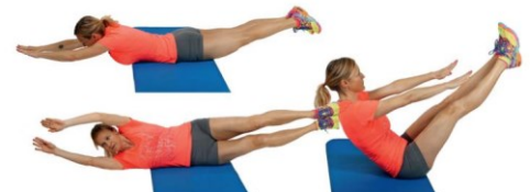
7 Kotaljenje izmenično v eno in drugo stran s hkratnim dvigom trupa in nog (zapiranje knjige).