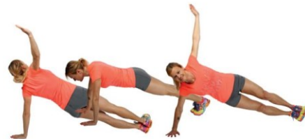
9 Izmenični zasuki trupa v opori ležno spredaj (stopala ves čas skupaj).