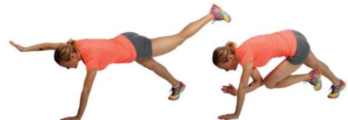
10 Hkratni dvigi nasprotne roke in noge v opori ležno spredaj (nato menjava roke in noge).