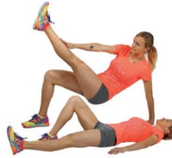
4 Upogibi trupa z dotikom nasprotne roke in noge iz hrbtne leže skršno z eno nogo s hkratnim dvigom v oporo (nato menjava rok in nog).