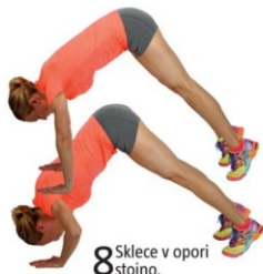
8 Sklece v opori stojno.