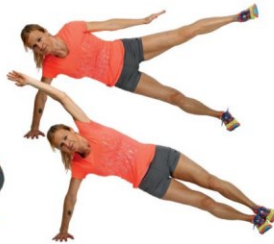
2 Hkratni primiki roke k nogi v opori bočno (nato menjava strani).

Glavni del vaj (vaje za moč) Glavni del je 8 vaj moči s svojo telesno maso, ki jih izvajamo v 10 do 15 ponovitvah v eni do treh nizih.