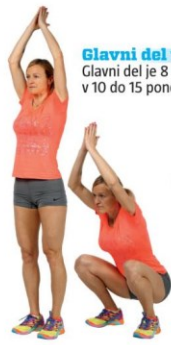
1 Globoki počepi z dvigom rok iz priročnja v vzročnje (dotik dlani nad glavo).

Spodnje elemente lahko uporabite v poligonu ali pa jih naredite kot vadbo za telesno moč.