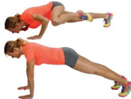
3 Sklece na eni nogi v opori ležno spredaj (z izmeničnimi dotiki kolens s kolenčcem).