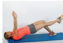
6 Dvigi bokov iz hrbtne leže skršno z eno nogo (druga noga dvignjena od tal, nato menjava nog).