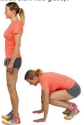
5 Vojaška vaja (s sklecami in poskoki).