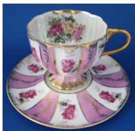
a cup and a saucer

https://en.pons.com/translate/english-slovenian/saucer