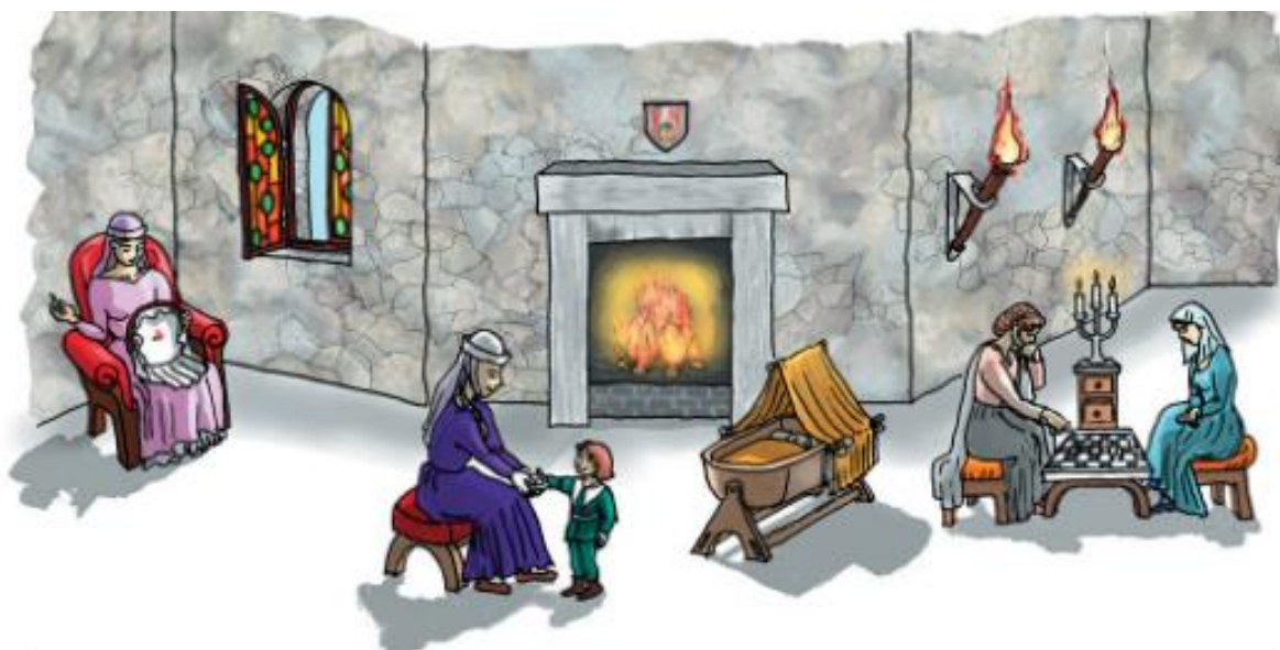
Grajske gospe so nadzorovale vzgojo otrok in se kratkočasile z igrami ali ročnim delom.

Življenje na srednjeveških gradovih ni bilo preveč prijetno, še zlasti pozimi. V gradovih je bilo hladno in temačno. Svetili so si z baklami in lojenkami. Kopalnic niso poznali in celo stranišča so bila redka.