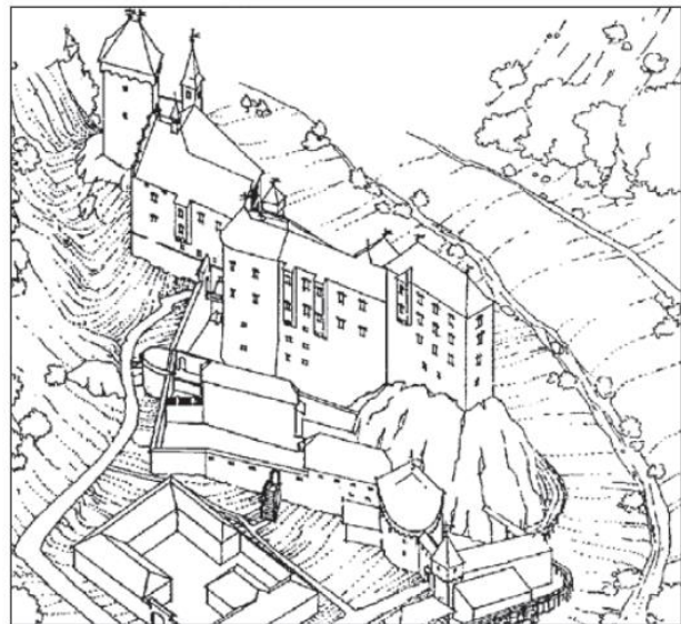
Grad Kamen v 12. in v 16. stoletju