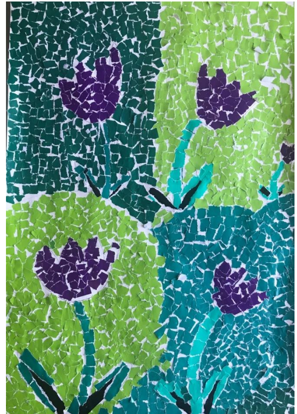
Trganka je delo učenke 4. razreda