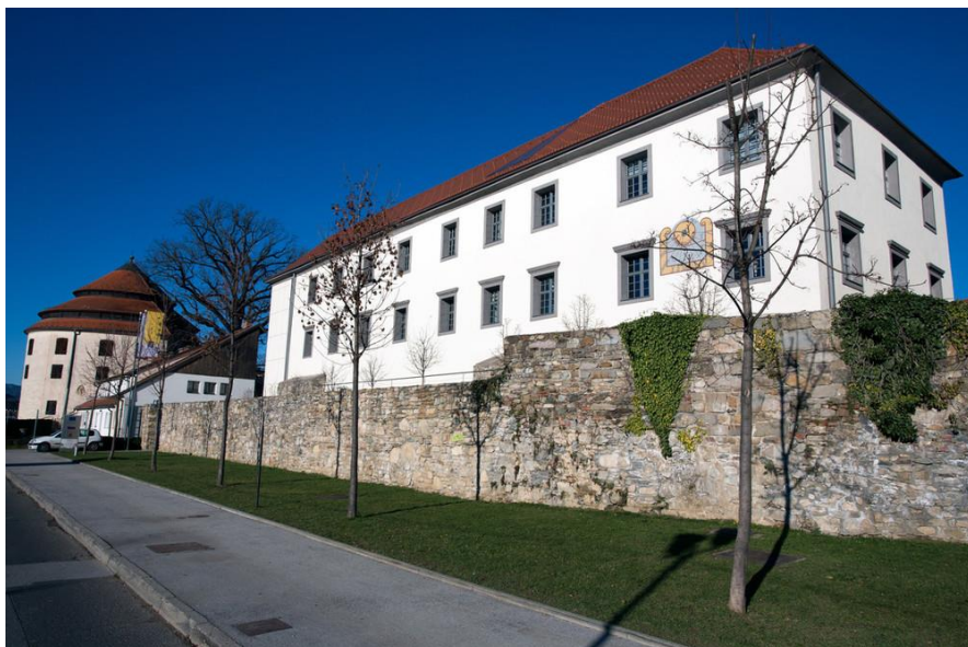
LUTKOVNO GLEDALIŠČE MARIBOR