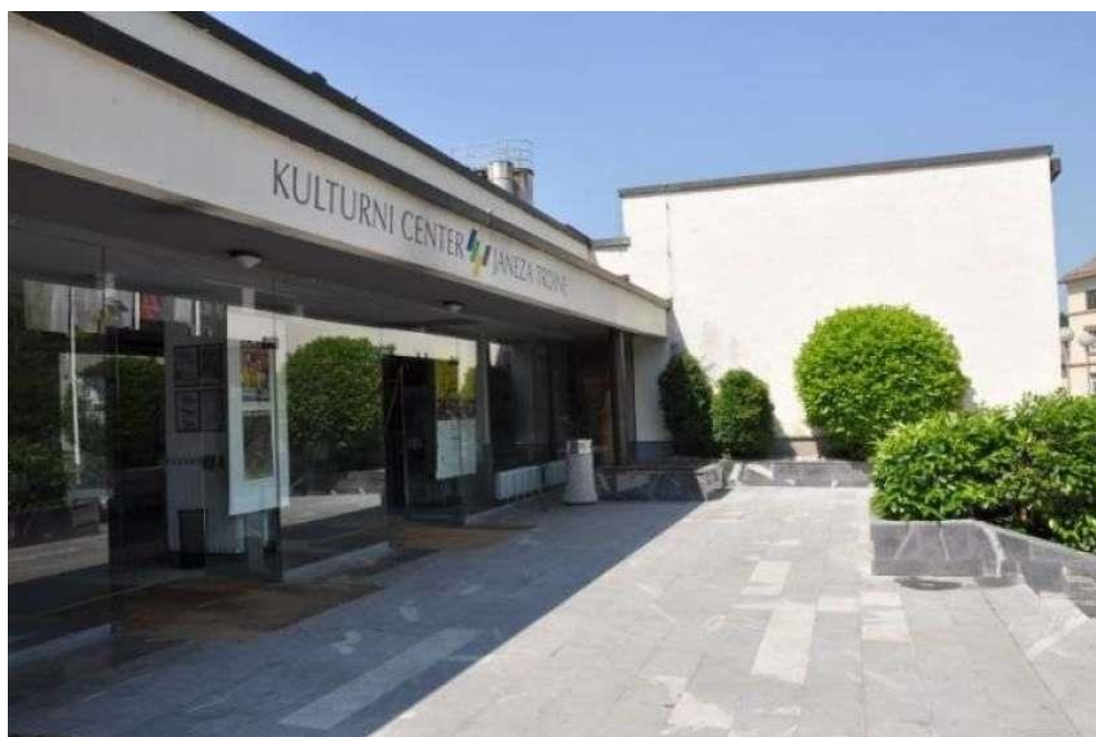
KULTURNI CENTER JANEZA TRDINE