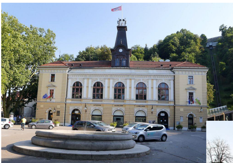
LUTKOVNO GLEDALIŠČE LJUBLJANA

Oglej si spodnje fotografije gledališč v Sloveniji. Kje si že bil/a?