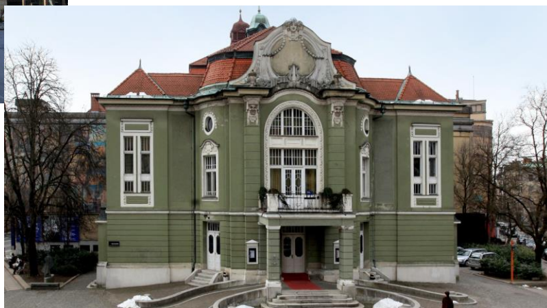
SLOVENSKO NARODNO GLEDALIŠČE DRAMA LJUBLJANA