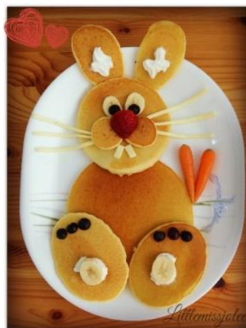
IZZIV ZATE: ZAJČEK IZ MINI PALAČINK