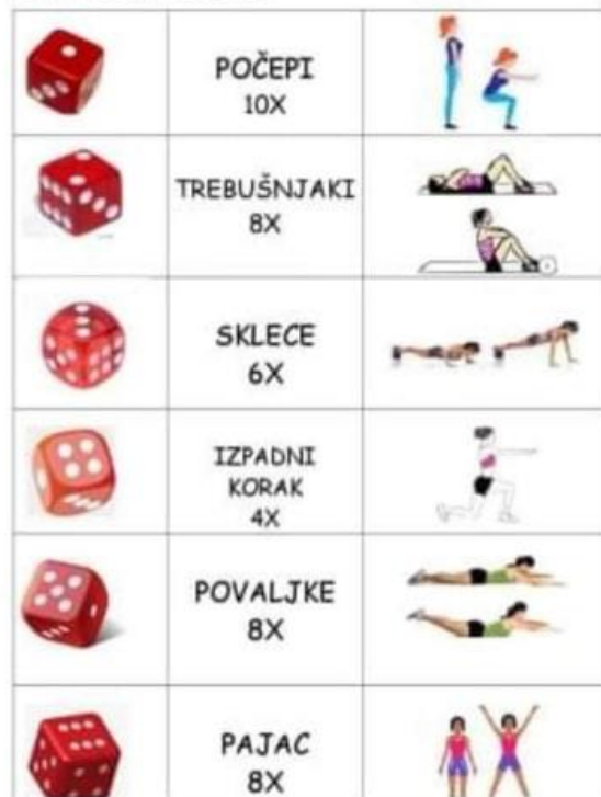
NAJ KOČKA ODLOČI

SKOK V DALJINO Z MESTA: Na spodnjem posnetku si večkrat dobro poglej, kako poteka mesta. poskusi skok v daljino z Ob ogledu posnetka enako storiti tudi ti.